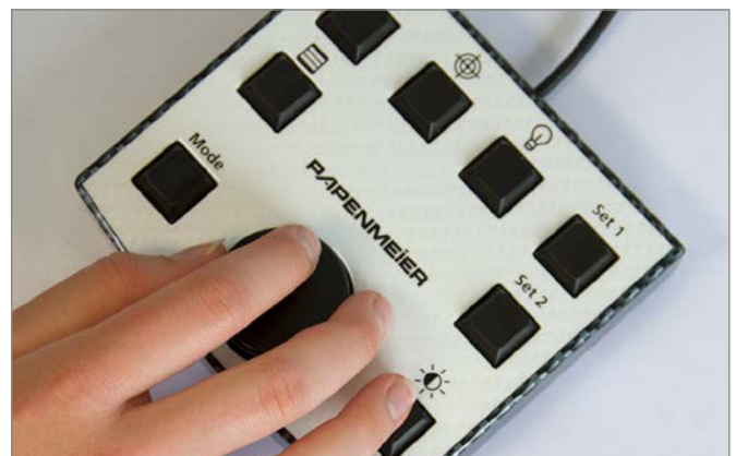
VISULEX® Maki, Bedienungspanel